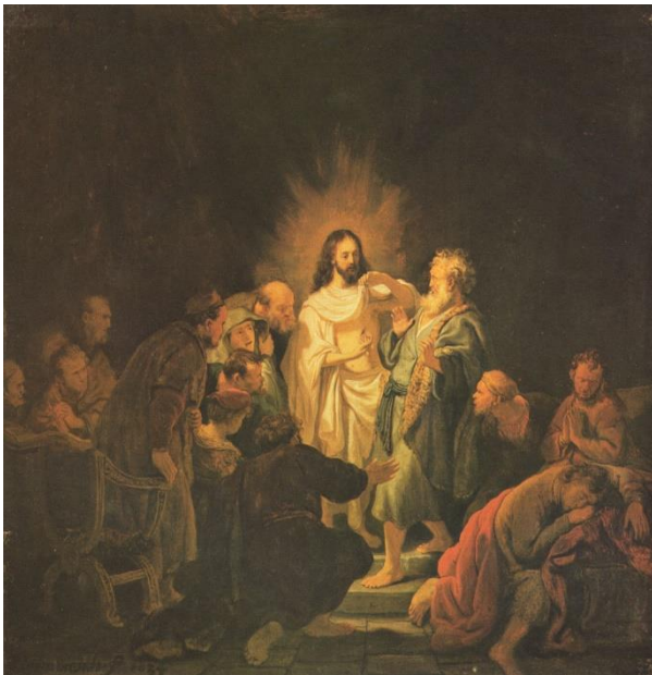
Rembrandt De verschijning van Jezus aan Thomas

'Lastige mensen', vinden andere mensen 'je moet niet altijd zo opstandig zijn!'. Maar zelf zeggen zij: wij kunnen niet anders en dat komt door dat oude verhaal. Hij is opgestaan, zeggen ze, echt opgestaan! En waarom wij dan niet ? uit : Beweeg-redenen p 17-18