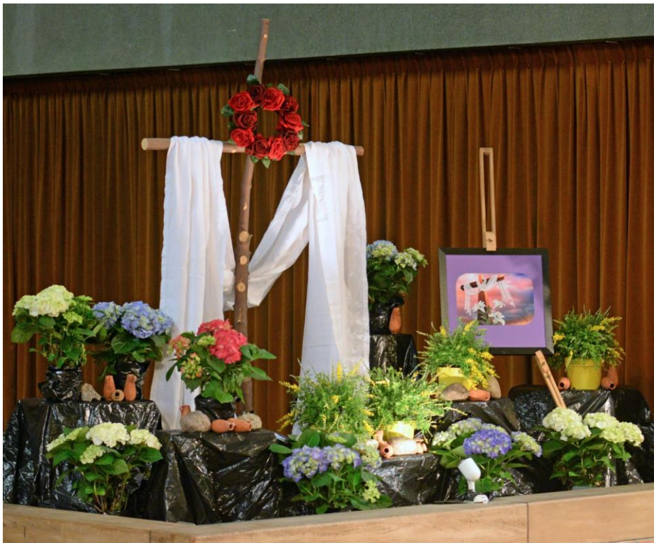
Paastuin in de kerk van de Martelaren van Gorcum

2020 € 8.765,00 = met Pasen+ € 2.025,00 Boekenmarkt samen: € 10.790,00